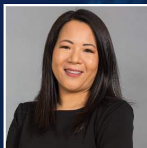
ENORY OKUMA FULLITA

Arbitraje Potestativo (Laboral) / Convenios Colectivos